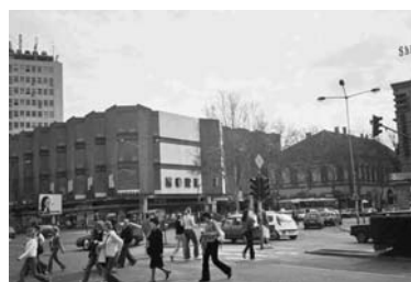
Слика 5. – Зграда Норка, на крају Јеврејске улице (Гарача, 2005)

Још један еклатантан примјер негативног утицаја савремених процеса на физиономију насеља јесте изградња Српског народног позоришта,