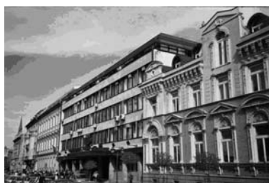
Слика 4. – Зграда Континентал банке (Гарача, 2005)

Овај период обиљежен је планском изградњом, односно пробијањем западног дијела Булеvara Михајла Пупина, којом приликом су порушене зграде на прелазу из Улице Краља Александра у Народних Хероја, међу којима посебно значајне зграда Мађарске гимназије и јерменска црква. На овим мјестима и у околини граде се, обликом, величином и материјалом, потпуно неприкладни објекти. То су зграде „Базара“, „Норка“, Поште.