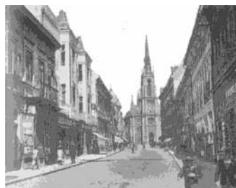
Слика 9. – Стара Јеврејска прије градње СНП-а (Петровић, 1963)