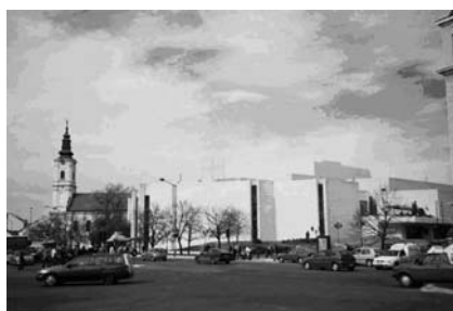
Слика 7. – Зграда Српског народног позоришта (Гарача, 2005)