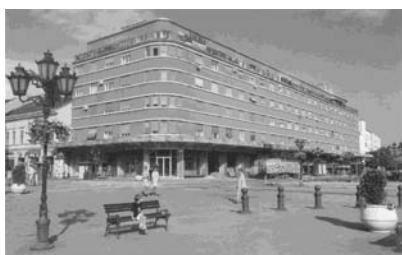
Слика 2. – Танунџићева палата на Тргу Слободе (Група аутора, 2004)

добијен је потпуни несклад. Примјер за то је Улица Модене са двије зграде, палате, грађене у стилу модерне. То су Танунџићева палата и зграда позната под називом „Албус“, према реклами, која већ деценијама стоји на њој. Том приликом је порушено неколико зграда, које су повезивале Змај Јовину и Улицу Краља Александра, чинећи изванредну амбијенталну цјелину. Међу њима је и некадашња зграда Матице српске, која се наслањала на зграду хотела „Војводина“.