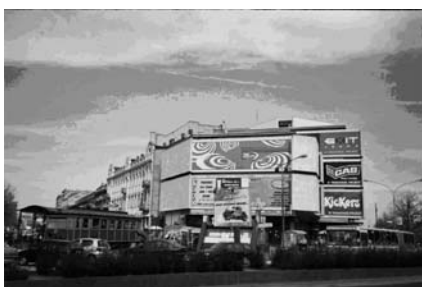
Слика 6. – Зграда Базара на крају Краља Александра (Гарача, 2005)

када је порушен читав низ објеката на лијевој страни Позоришног трга, некада Јеврејске улице. То је била веома складна цјелина, налик оној на десној страни поменутог трга. Зграда позоришта је дјело модерне архитектуре са краја XX вијека, изграђена од бетона, обложеног бјелим мермерним плочама. Кубичког је облика, строгих ивица и веома сведене архитектонске форме. У том смислу, естетски потпуно испада из окружења у које је смјештена. О томе да је Новосађани никада нису у потпуности прихватили говори и чињеница да је и данас називају „Бункером“.