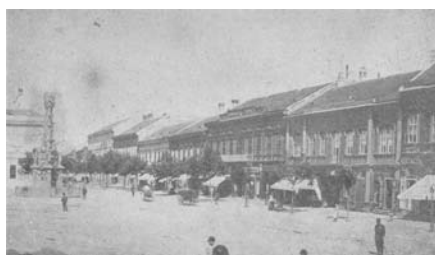
Слика 3. – Десна страна Трга Слободе прије градње палате (Група аутора, 2004)