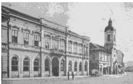
Слика 8. – Улица Краља Александра прије градње Базара (Петровић, 1963)