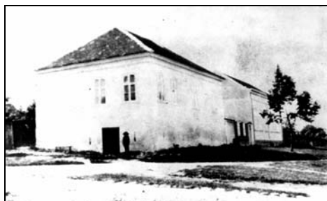
Слика 3. – Кућа у Лозници у којој се родио Јован Цвијић