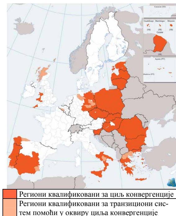
Слика 1. Конвергенција – ERDF, ESF 2007-2013