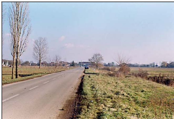
Најшира улица у Србији – источни део главне улице Карловчића

Изградњом мреже дренажних канала, средином 20. века, централно подручје села и његова околина је осушена. Тада су се стекли адекватни грађевински услови да се село неспутано развија како у правцу североистока тако и у правцу југозапада. Средином југоисточног дела шора, 1975. године, трасиран је асфалтни пут, а у северозападном делу изграђена је школска зграда. Преко овог пута одвијао се главни друмски саобраћај на релацији Београд – Сремска Митровица све до изградње ауто-пута Београд – Загреб.