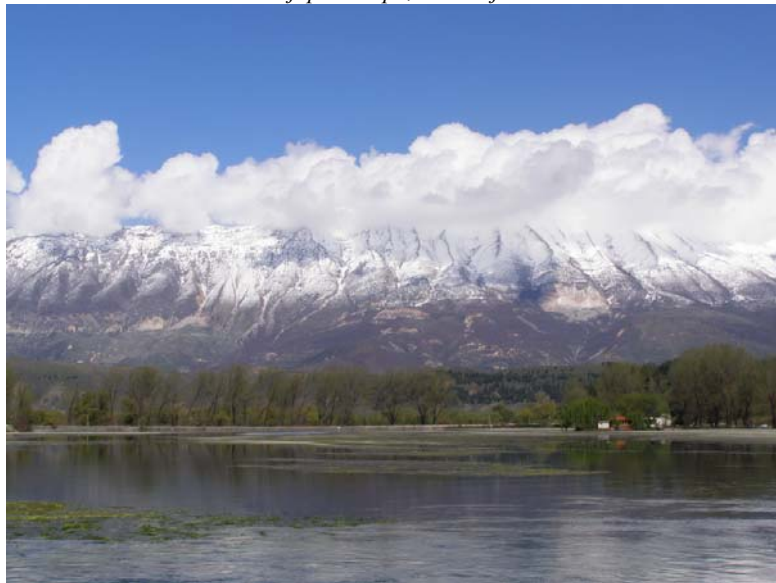
Језеро Пазари Влоки, Албанија