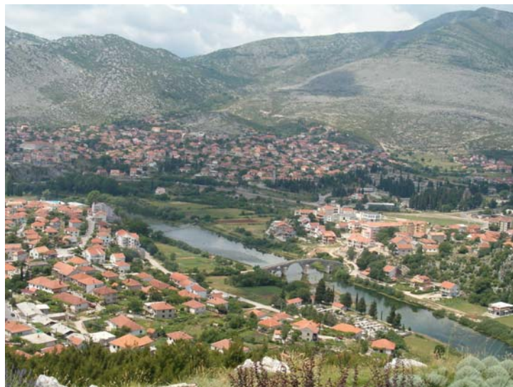
Поглед на део Требиња и Арсланагића мост