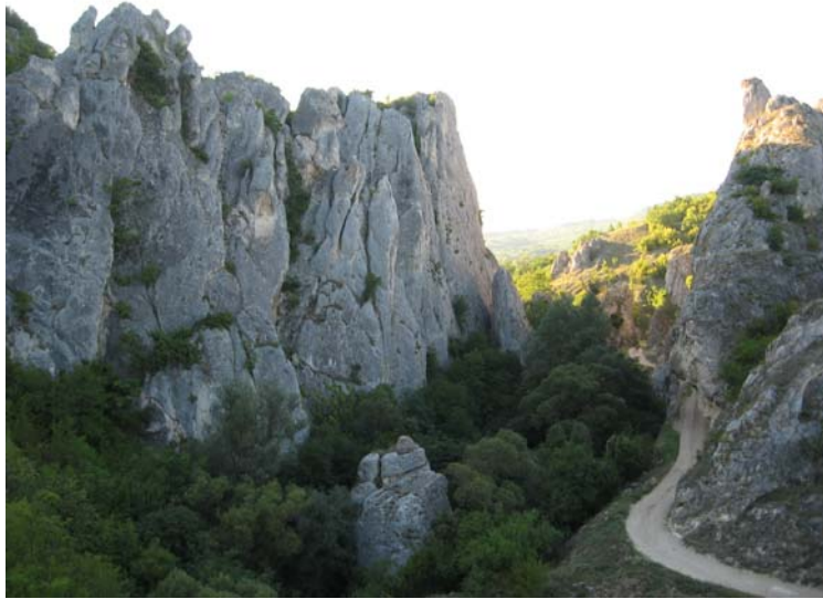
Централни део клисуре Ждрело