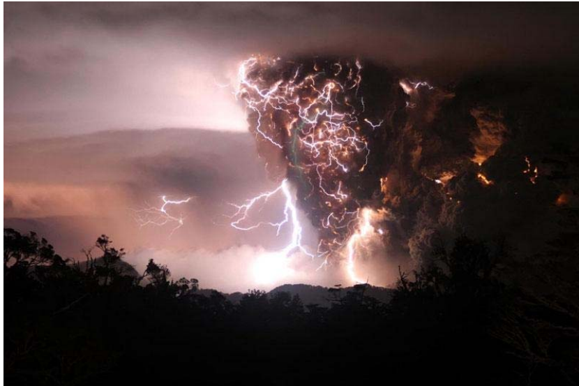
Разорна ерупција вулкана Чајтен у Чилеу, 2. мај 2008. године