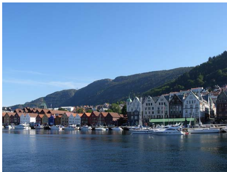
Историјски део Бергена, Норвешка, из 16. века под заштитом UNESCO