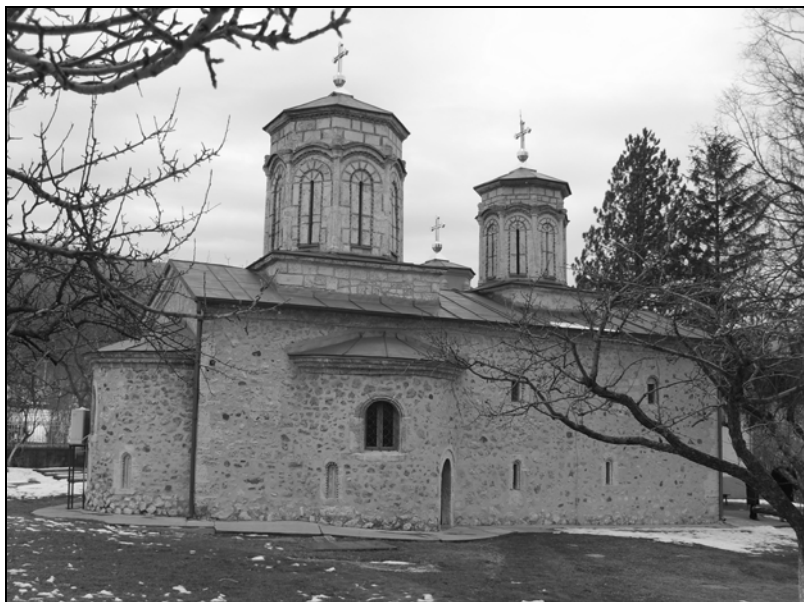
Манастир Св. Петка