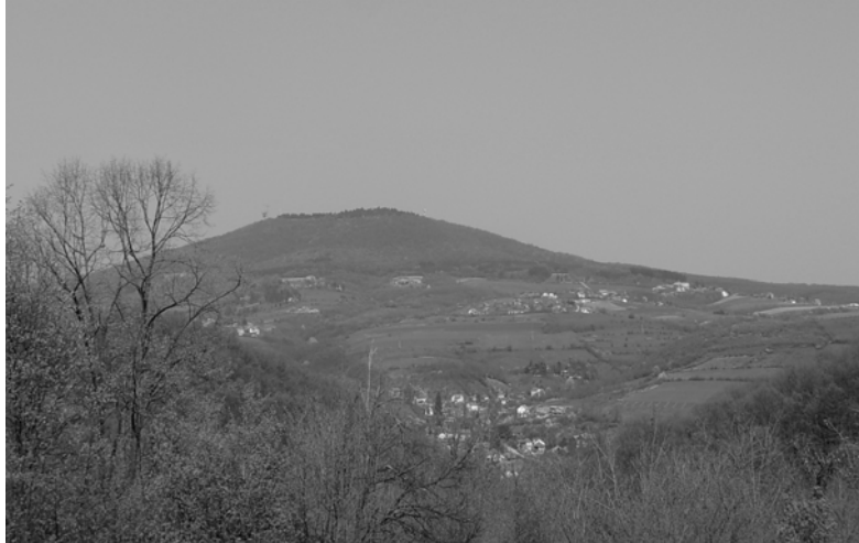
Авала (поглед са југа)

заштите Авале, која датира још из деветнаестог века и периода књаза Милоша. Авала и Космај до коначног статуса заштите као предела изузетних одлика стижу тек 2007. тј. 2005 године.