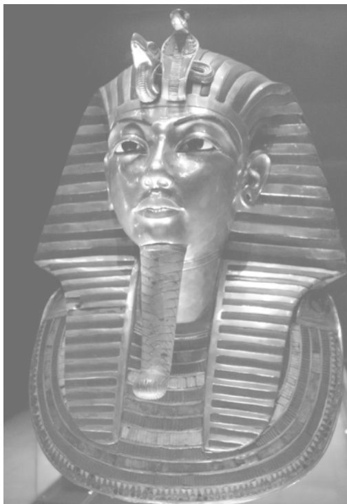
Златна маска Тутанкамонове мумије у Египатском музеју у Каиру

било ланено платно и венци цвећа. У њему је био и трећи ковчег од стотину десет килограма злата. Краљ је приказан са капом са кобром на челу, огрлицом са златним и керамичким перлама, док у рукама држи скиптар и бич, два симбола египатског краљевства. У овом ковчегу је била нетакнута мумија Тутанкамона, прекривена златом и драгуљима. Лице деветнаестогодишњег владара било је прекривено златном посмртном маском опточеном полудрагим камењем.