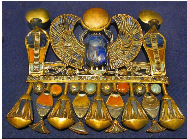
Тутанкамонова амајлија, тзв. „срце скарабеј“

Прича о Долини краљева почиње изненадном одлуком фараона Тутмеса I да одвоји своју гробницу од загробног храма. Осим тога, одлучио је и да не буде сахрањен у репрезентативном споменику, већ на недоступном и скровитом месту. Ова одлука прекинула је традицију дужу од седамнаест векова. Његов главни архитекта, Инени, ископао је гробницу унутар стене. Улаз у гробницу повезан је стрмим пролазом са просторијом у којој ће бити смештен саркофаг. Овакав план гробнице пратили су и фараони након Тутмеса I. На изградњи и украшавању гробница радили су становници оближњег села Деир ел-Медина које се налази између Долине краљева и оближње Долине краљица. Свакодневни живот ових радника насликан је у неким гробницама, описан у неким документима, а можда се овде и десио први забележени штрајк радника.